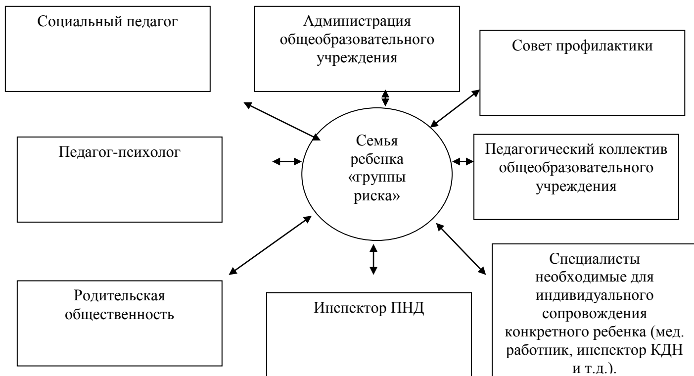
Схема 3 «Организация взаимодействия индивидуального сопровождения для семей ребенка «группы риска»»

полностью отказались от них добровольно. Поэтому гимназия работает и семьями детей группы риска. Результатом диагностического этапа социально-педагогической технологии является составление карт личности[1].